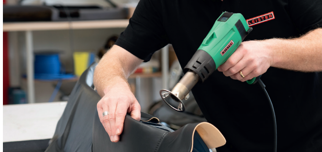
SOLANO AT - Partes de cuero sensibles - procesar de forma segura y eficiente